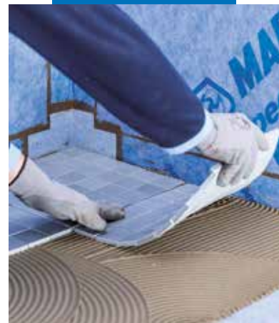
Pose de carrelage