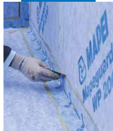
Application de Mapeguard ST

Toutes les références relatives à ce produit sont disponibles sur demande et sur le site www.mapei.com