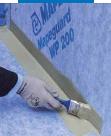
Application de Mapeguard WP Adhesive pour la réalisation de l'étanchéité des angles avant l'application de Mapeguard ST