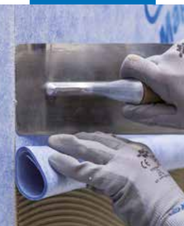
Application de la deuxième membrane