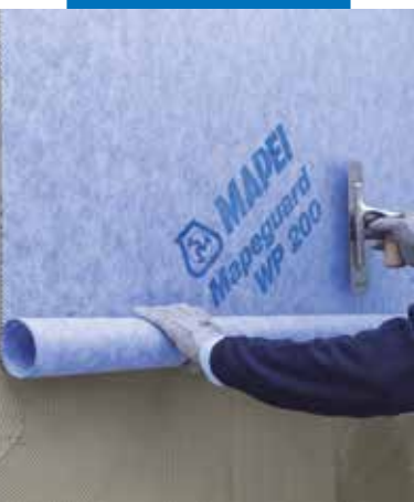
Pose de Mapeguard WP 200